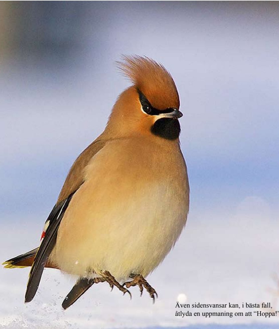
Även sidensvansar kan, i bästa fall, åtlyda en uppmaning om att "Hoppa!"

För den som eventuellt vill ha en bok signerad och kanske dedicerad har jag nu köpt in några extra exemplar av "Pingvinliv". Det ser nämligen ut som om "Pingvinliv" kommer att sälja slut på Nordstedts förlag före jul-afton. Och eftersom fotoböcker är dyra produktioner skulle jag om jag själv varit förläggare tvekat att trycka nytt, i synnerhet som det i så fall blir efter julhandeln. (Det är det första bokexemplaret i en stor färgtryckning som kostar kanske 250.000:-350.000:-, den som får det exemplaret har med andra ord en dyr bok i sin hand, följande exemplar i en tryckning kostar däremot ungefär 33-35:- / styck att producera.)