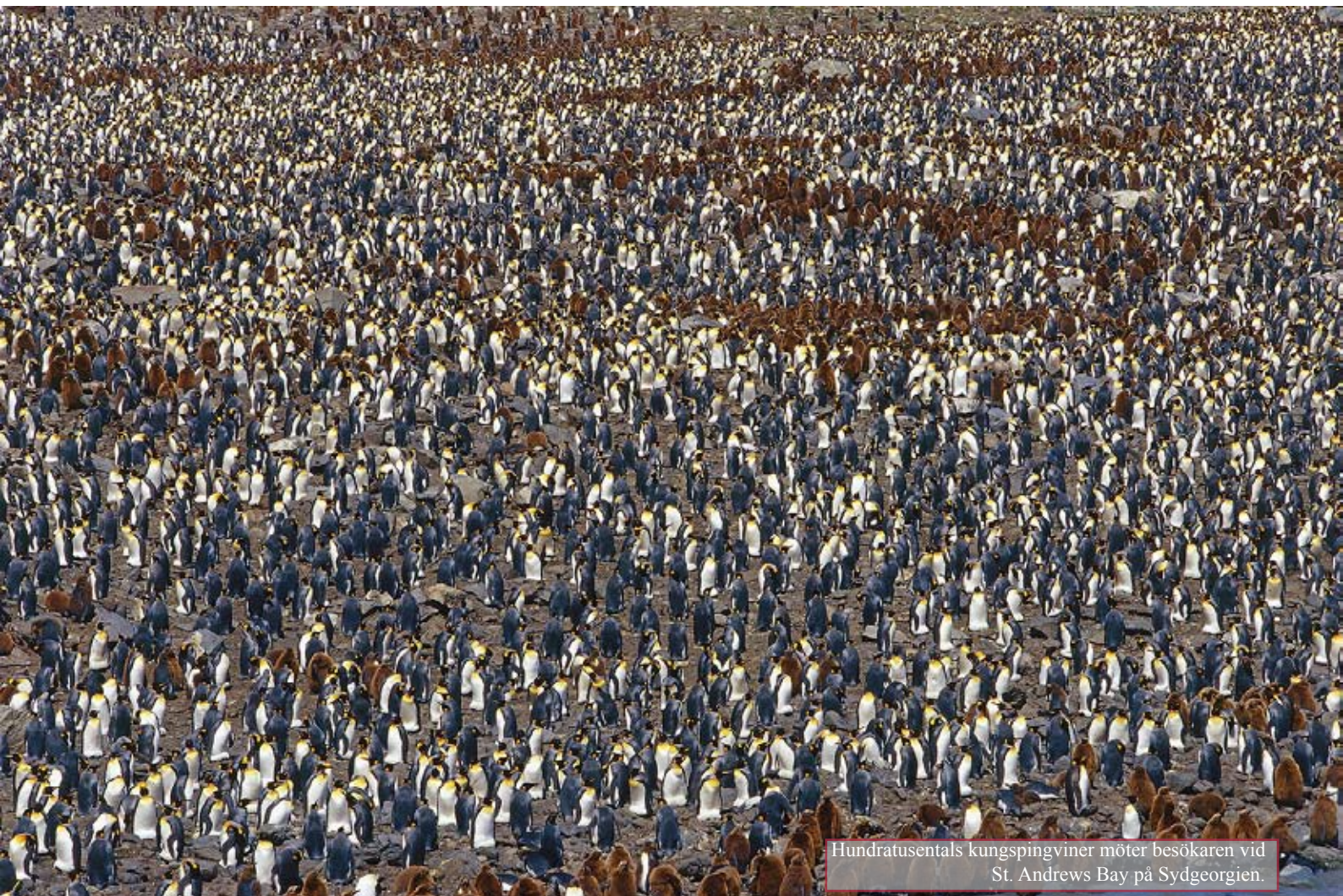
Hundratusentals kungspingviner möter besökaren vid St. Andrews Bay på Sydgeorgien.

Det är inte alla som tänker på det. Pingviner är inte en art. Det finns sjutton olika pingvinarter, de varierar i storlek och utseende och de lever i olikartade miljöer. Historiskt sett känner man faktiskt till litet över trettio arter, det största fossilet man hittat berättar om en pingvin stor som en människa och med en vikt på långt över etthundra kilo. Fast även om pingvinarterna skiljer sig åt har de en sak gemensamt, de kan inte flyga. Inte i luften i varje fall.