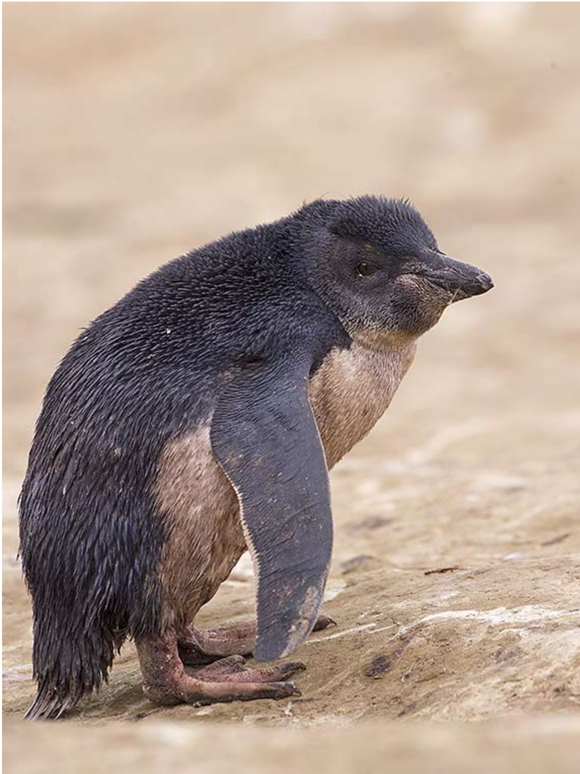
Unge av klipp hopparpingvin, Pebbles Island.