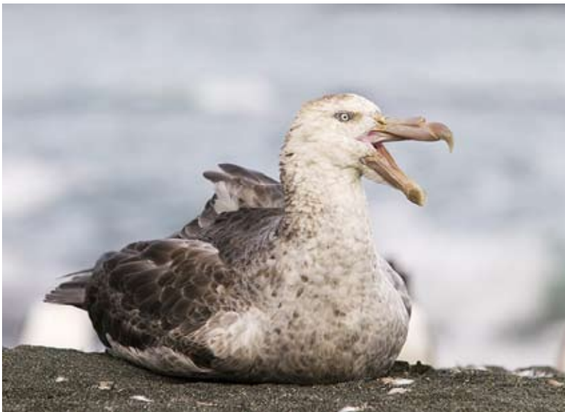
Juvenil, dvs. ung sydlig jättestormfågel, Sydgeorgien.

fann sig, tre ord som avlägsnade all min oro, nämligen ”just have fun.” Att jag helt enkelt bara skulle koncentrera mig på att ”ha kul”. Inte oroa mig för vad andra skulle tänka och tycka.