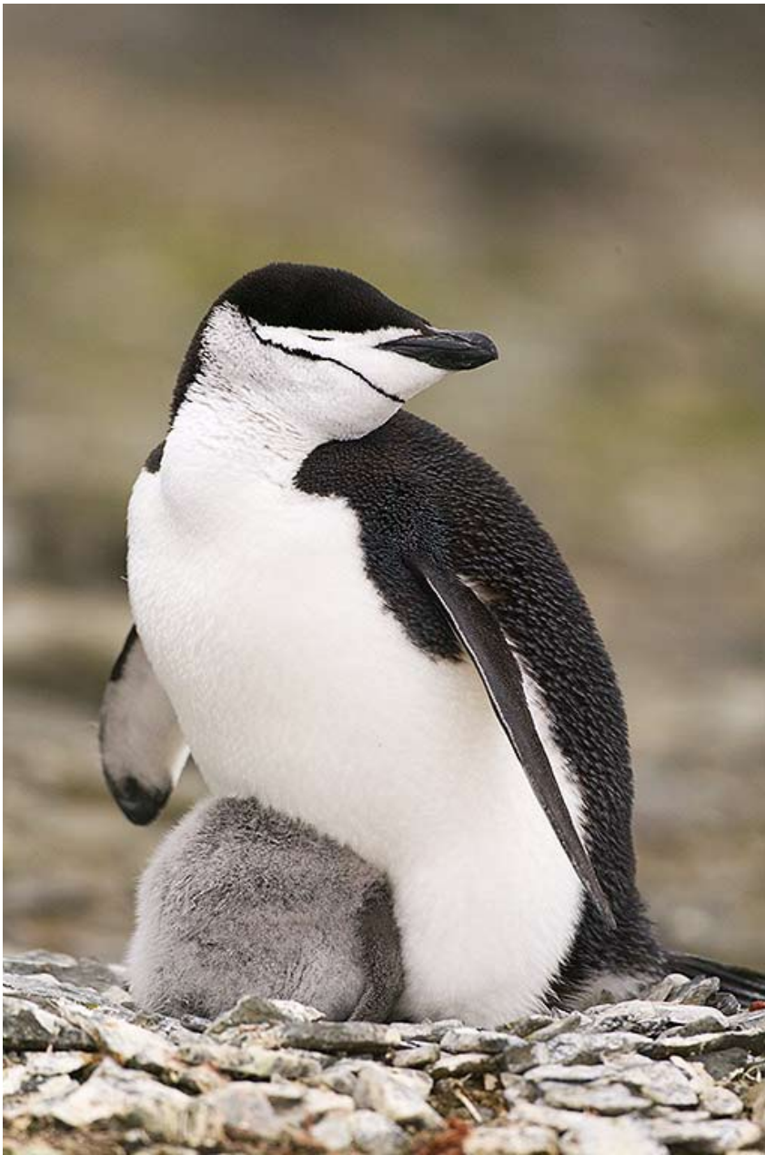
Hakremspingvinens unge söker värme i förälderns fjädrar, Antarktis.