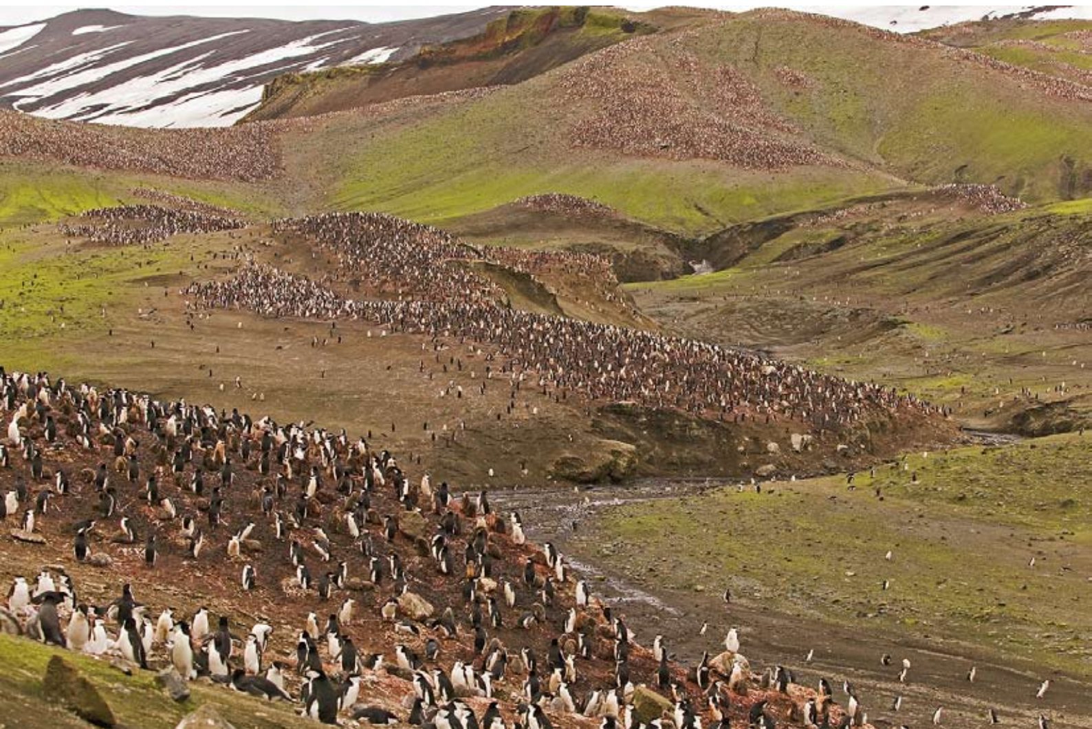
Hakremspingviner på olika kullar vid Baily Head, Deception Island, Antarktishalvön.