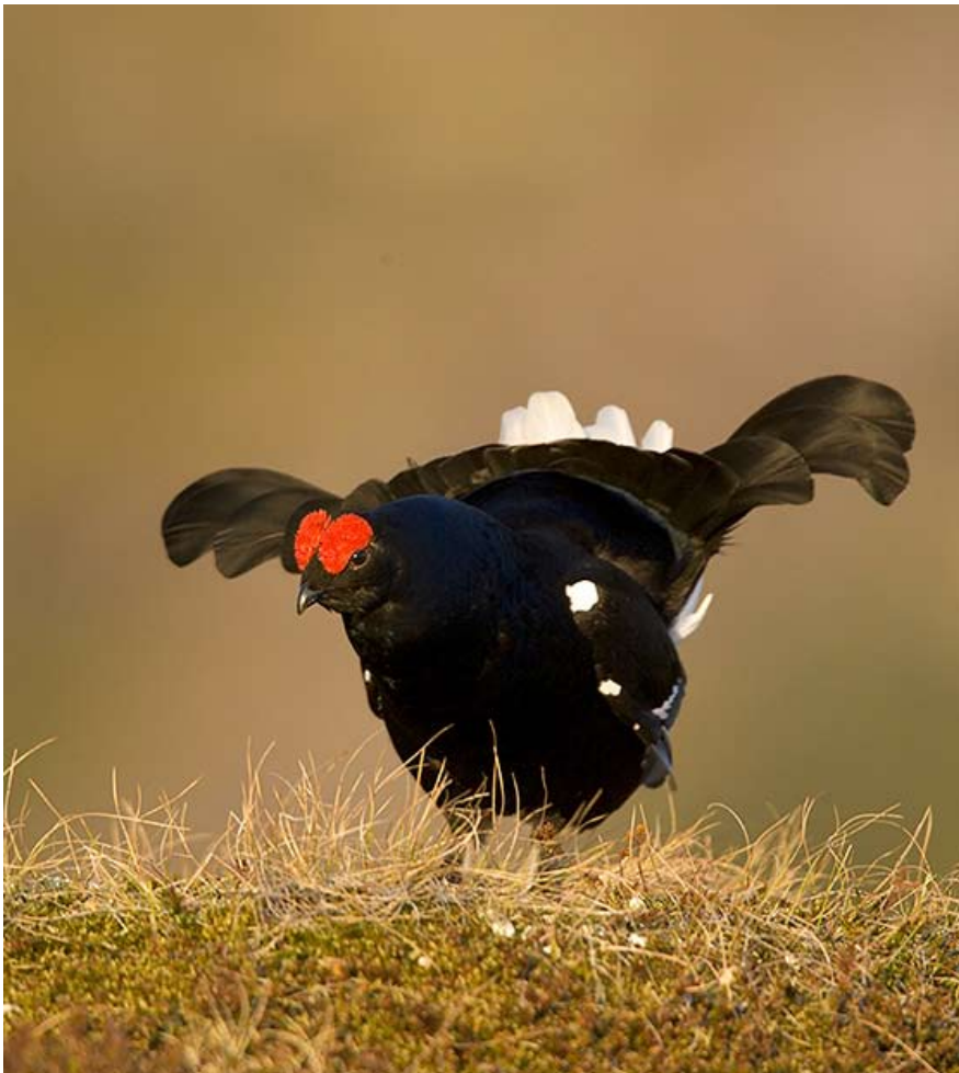
Orrtupp i tidigt morgonljus på berget.