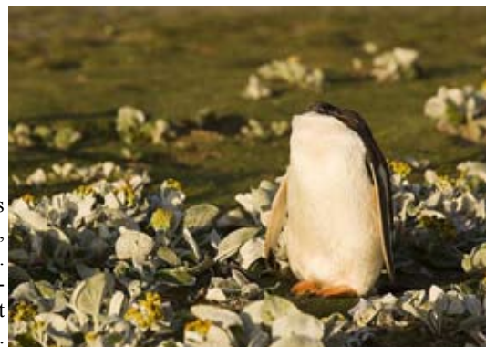
Huvudlös åsnepingvin, Saunders Island. Även åsnepingviner är rädda att tappa huvudet.

sak: att hamna i en situation där man måste försöka springa ifrån dom. För gör man det, då blir man definitivt jagad av inte bara en hanne utan av alla hannar som finns i närheten, alla lika övertygade om att de just fått tag i en hona redo för parning.