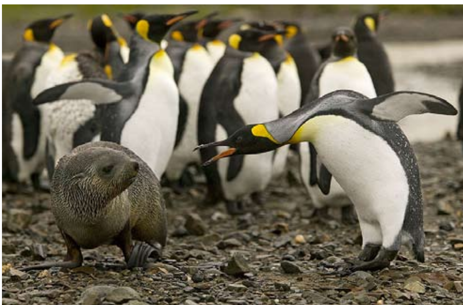
Även kungspingviner kan bli rejät irriterade på pälsälarna, här en sälunge som strax lommade iväg.

För även om pälsälarna är närgångna – man får använda en pinne och peta dom i bröstet med om dom kommer för nära – så ska man framför allt undvika en