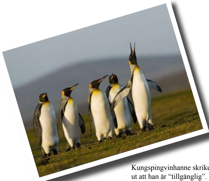
Kungspingvinhanne skriker ut att han är "tillgänglig".

timme plockade jag upp kameran. Alltid med frågan: var börjar jag i detta överflöd av motiv? Efter ett tag inser jag att det bara är att börja plåta där jag står och sedan får jag arbeta mig upp mot en kulle där jag kan få utsikt över hela kolonin.