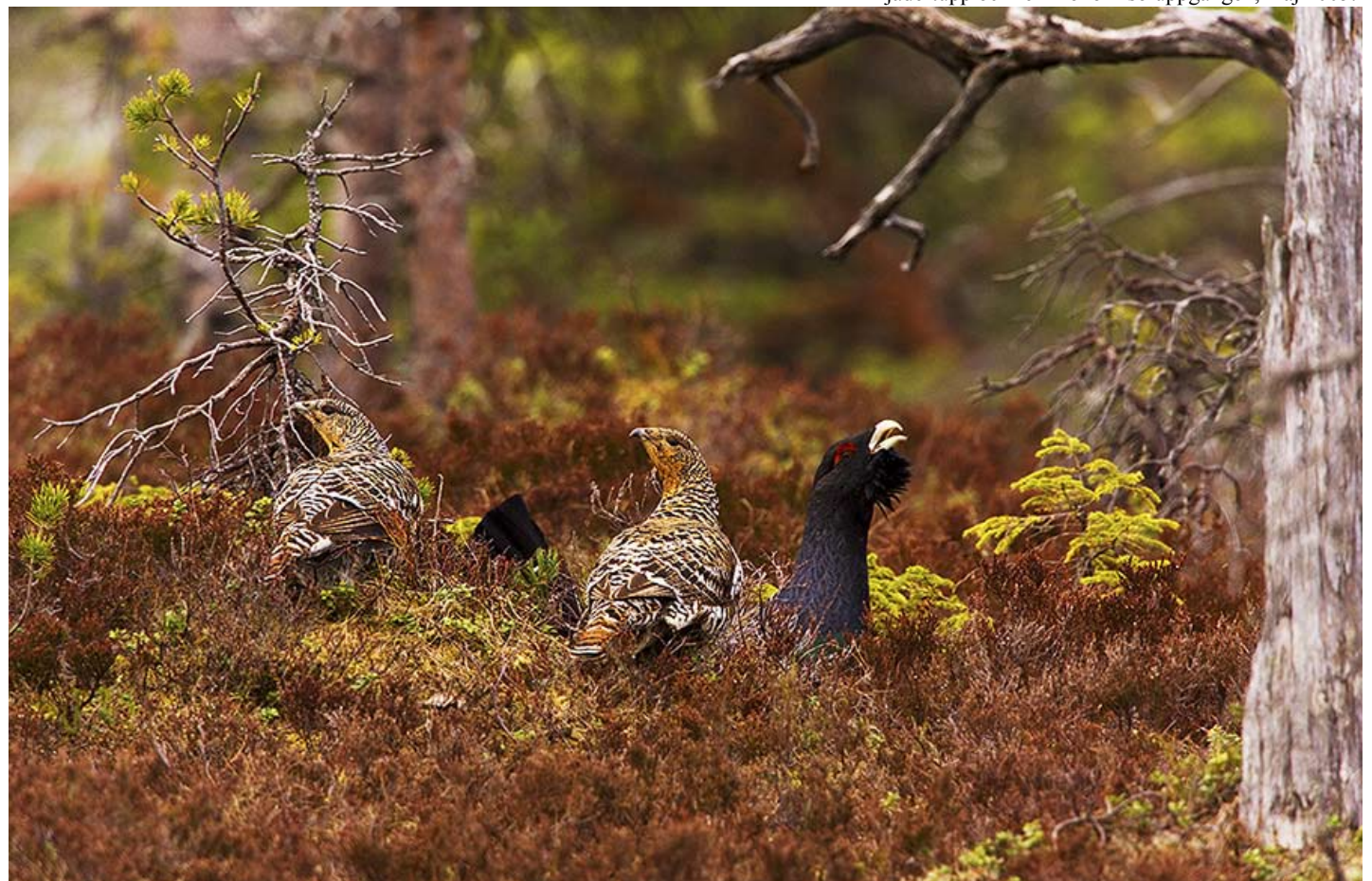
Tjädertupp och fem hönor i soluppgången, maj 2005.