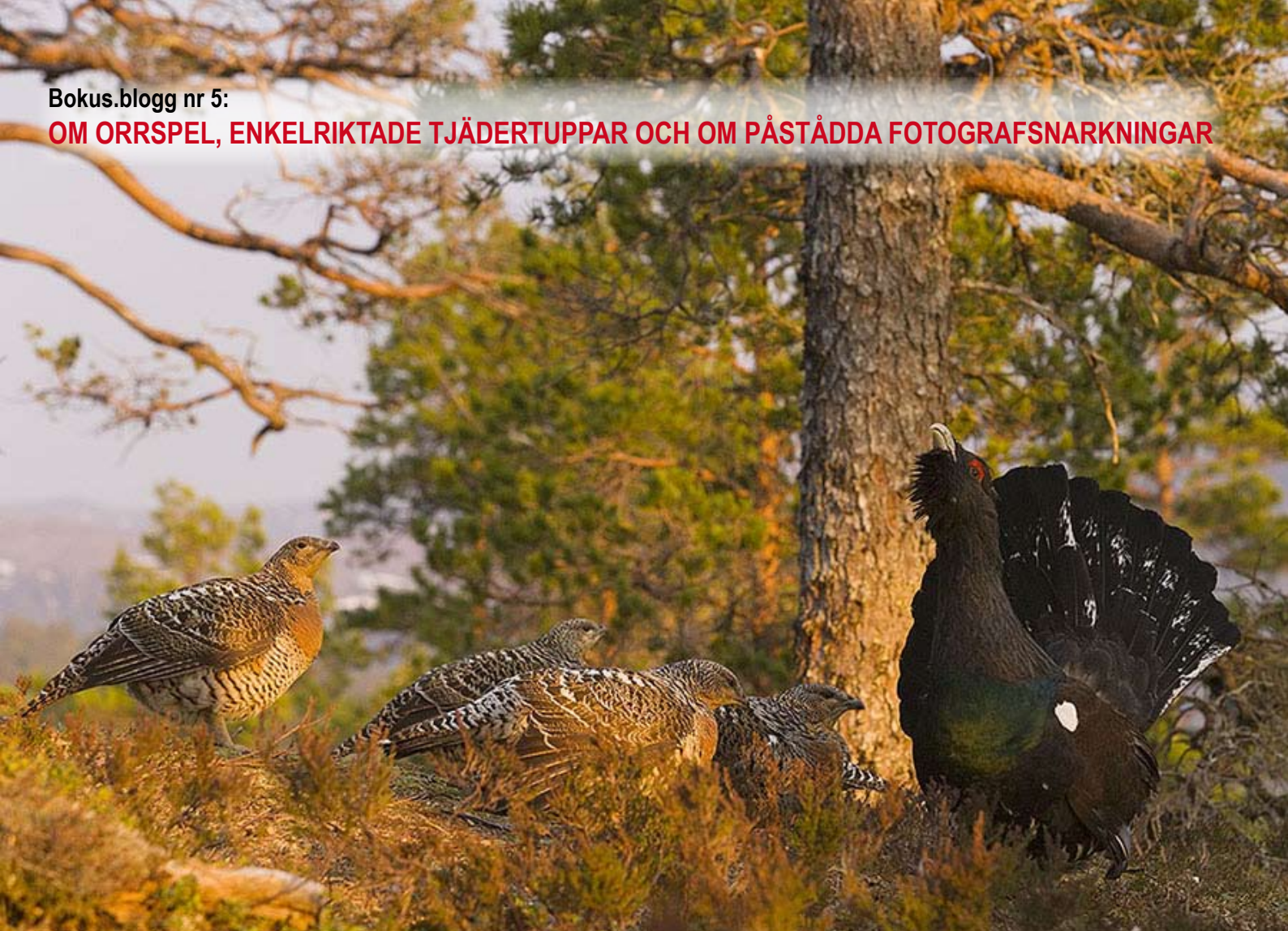
Tjädertupp och fem hönor i soluppgången, maj i år.

Den som vill fotografera orrspel måste vara beredd att vakna okristligt tidigt. Klockan sex eller sju är alldeles för sent. Man måste ge sig ut till spelplatsen på natten.