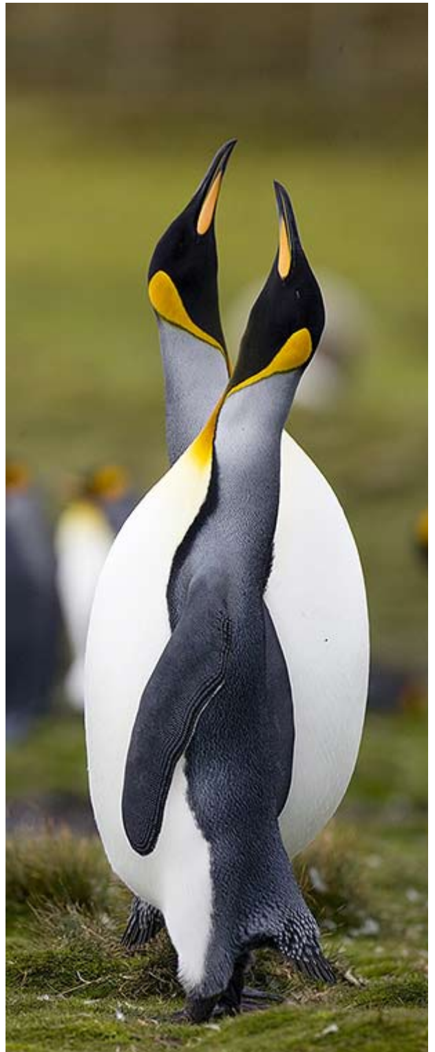
Med långt tele kan fotografen med en liten förflyttning uppnå effekter som inte hade gått med en kortare brännvidd. Canon EOS 1 Ds MarkII och 500/4.

Den svenska utgåvan av boken utkommer på Norstedts i augusti. Upplagorna i USA och UK utkommer strax före årsskiftet.