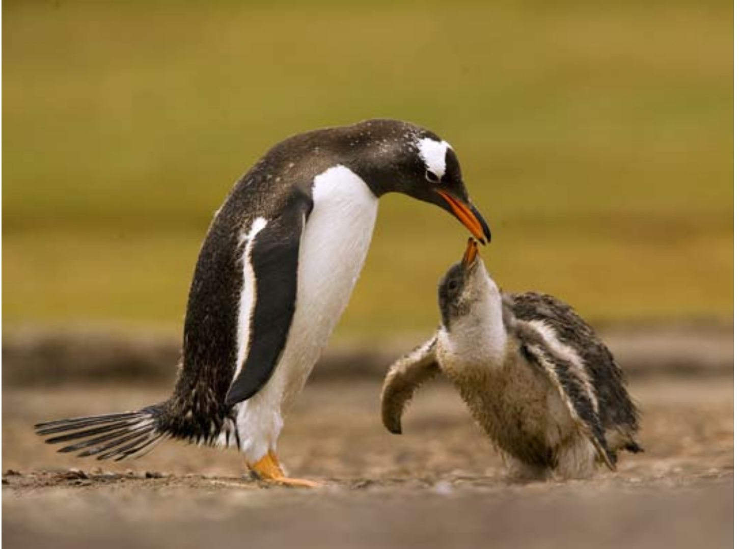
Åsnepingvin ska mata unge, Saunders Island. Canon 1 Ds Mark II, 100-400-zoomen, 400 mm tror jag. Genom att komma "i nivå" med pingvinerna uppnås en känsla av närhet, samtidigt lyckades jag bli av med alla andra pingviner i bakgrunden genom att använda ett relativt långt tele.