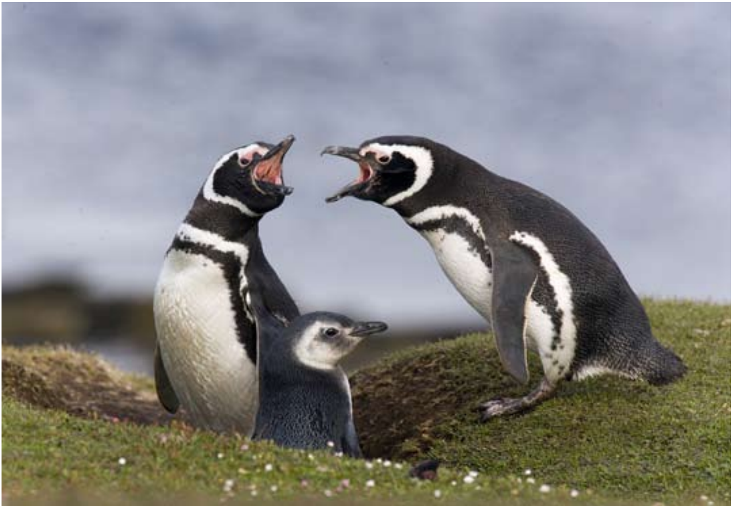
Magellanpar vid "flygfältet" på Saunders Island. Canon EOS 1 Ds Mark II, 500 mm med konverter 1,4.

redrar inte de superlätta varianterna) och mitt Wimberleyhuvud för det långa teleobjektivet ligger bredvid den mjuka väskan. Lite kläder – fågelguiden glömde jag i all hast – och toaletsaker. Trots försök att klara den godkända vikten kommer det att bli tjugo kilos övervikt när jag kliver på Falklandsplanet – fjorton kilo är maxvikt, inte direkt en fotografs dröm.