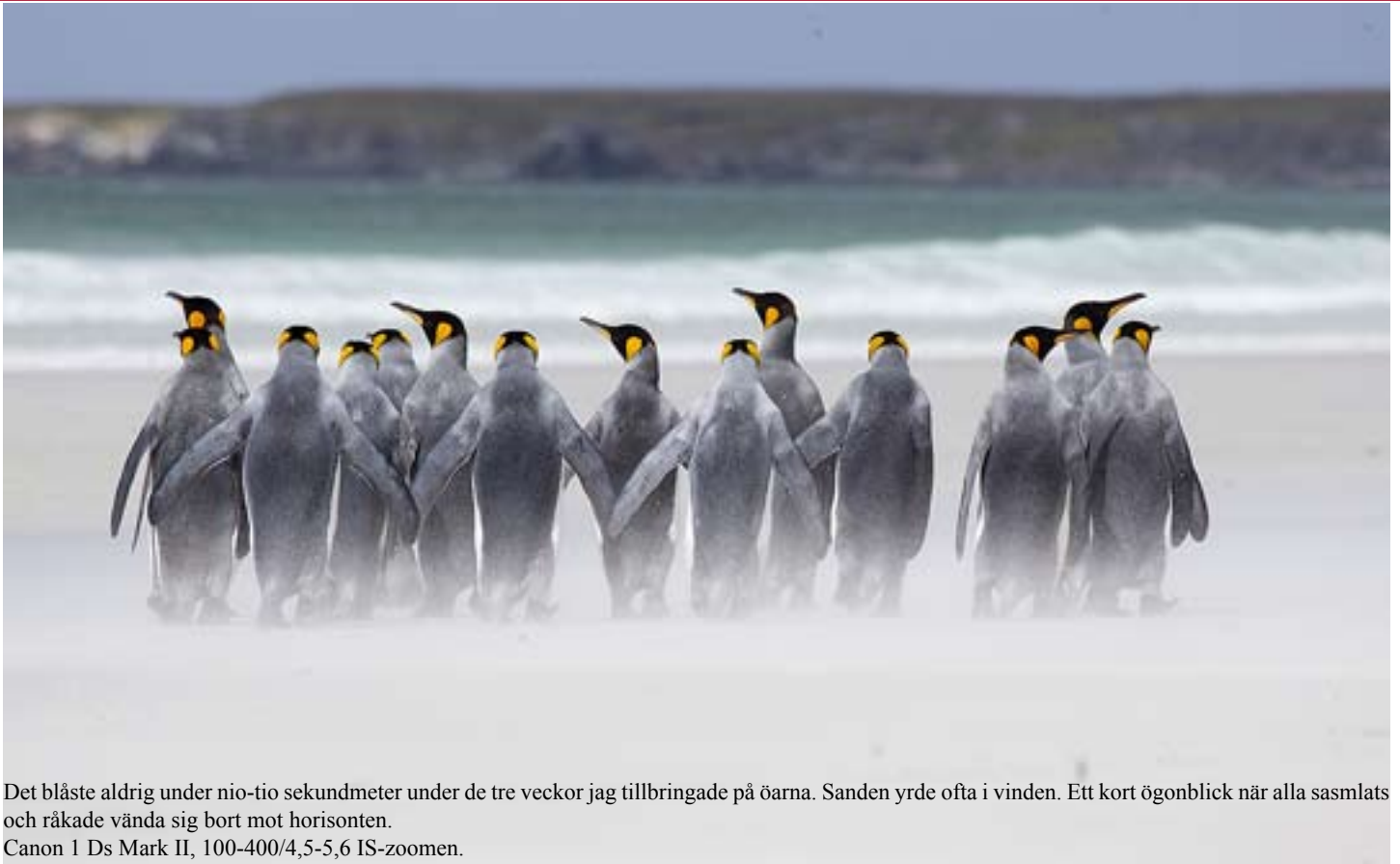
Det blåste aldrig under nio-tio sekundmeter under de tre veckor jag tillbringade på öarna. Sanden yrde ofta i vinden. Ett kort ögonblick när alla sasmlats och råkade vända sig bort mot horisonten. Canon 1 Ds Mark II, 100-400/4,5-5,6 IS-zoomen.