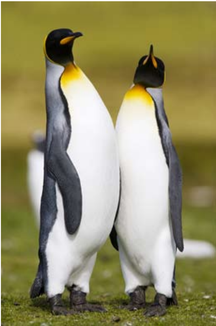
Med långt tele kan fotografen med en liten förflyttning uppnå effekter som inte hade gått med en kortare brännvidd. Canon EOS 1 Ds MarkII och 500/4.

På Sydgeorgien bodde sju människor när jag besökte ön för tre år sedan. Men desto fler pingviner, flera hundratusen kungspingviner i fantastiska jättekolonier. Och på Falklandsöarna många tusen pingviner av arterna klippheppare, åsne- och magellanpingviner och mer än tusentalet kungspingviner, de senare nästan alla vid Volunteer Point på huvudön.