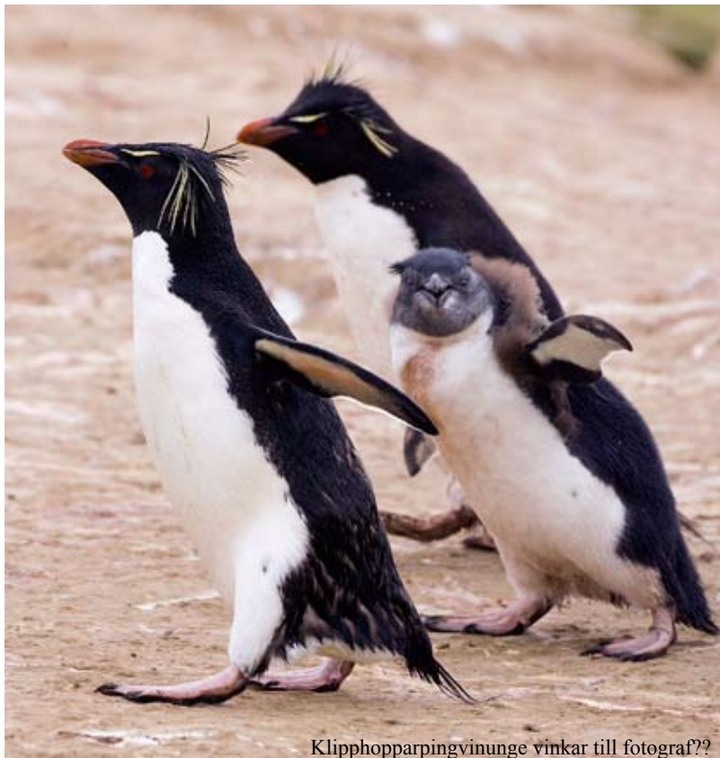
Kliphopparpingvinunge vinkar till fotograf??