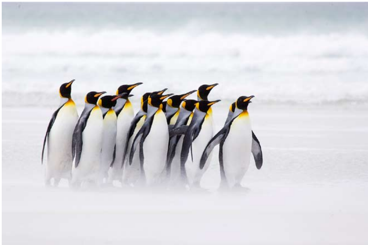
Kungspingviner vid Volunteer Point på Falklandsöarna. Jag inväntade tills de var någorlunda samlade. Bilden är tagen med Canons oerhört användbara telezoom 100-400 med IS, lätt att handhålla även vid 400 mm.

Själv har jag nu tagit ett par veckors semester med familjen – och med kameran undanstoppad!