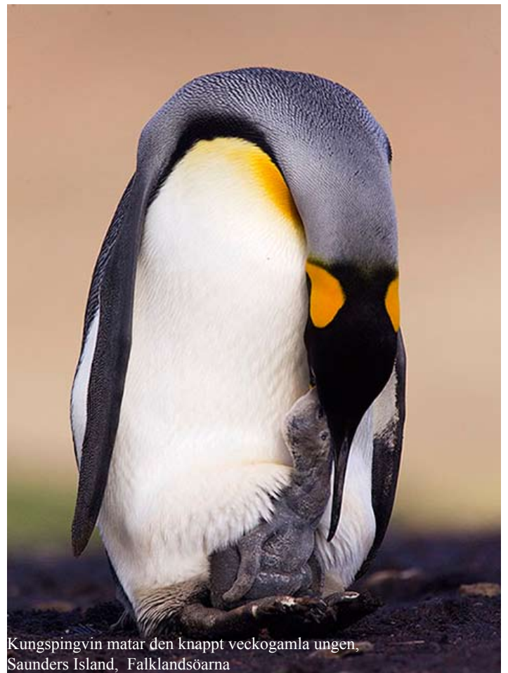
Kungspingvin matar den knappt veckogamla ungen, Saunders Island, Falklandsöarna

Den fotointresserade noterar säkert att jag generellt använder relativt höga ISO-tal, eftersom kvaliteten på de digitala filerna är så otroligt bra. Kanske ökar bruset något, men det är inget i jämförelse med gamla diafilmer vid samma känslighet, och de bilder som kan räddas med det högre ISO-talet vill jag inte missa.