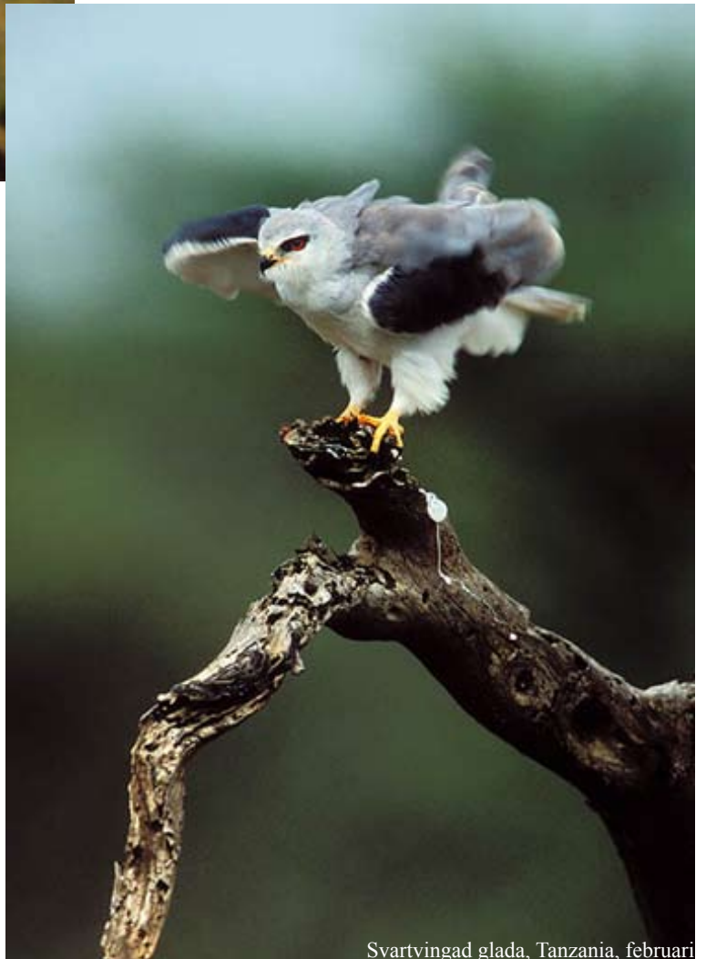
Svartvingad glada, Tanzania, februari

Fotoboken “Mellan vingpetsarna” rör sig från häckare på tundran i norra Kanada och myrmarker i norra Skandinavien till övervintrare på savannerna i Afrika, från havsfåglar på Spetsbergen, Island och längs Norges kust till albatrosser och pingviner på Sydgeorgien och Antarktis, från skogarna i norra Sverige och Kanada till ökenområdena i Texas/Mexiko och Spanien. Boken är tryckt i storformat, 24 x 31 cm, och omfattar 208 sidor och närmare 230 bilder.