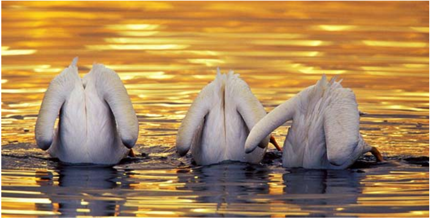
Hornpelikaner, Kalifornien, januari