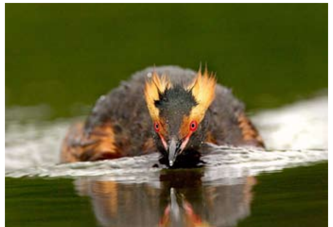
Svarthakedopping, Finland, juni