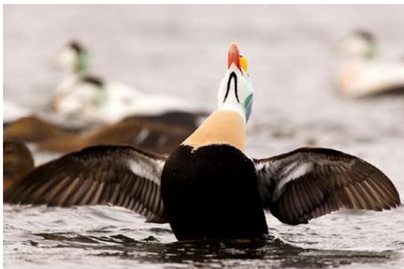
Praktejder, Nordnorge, februari