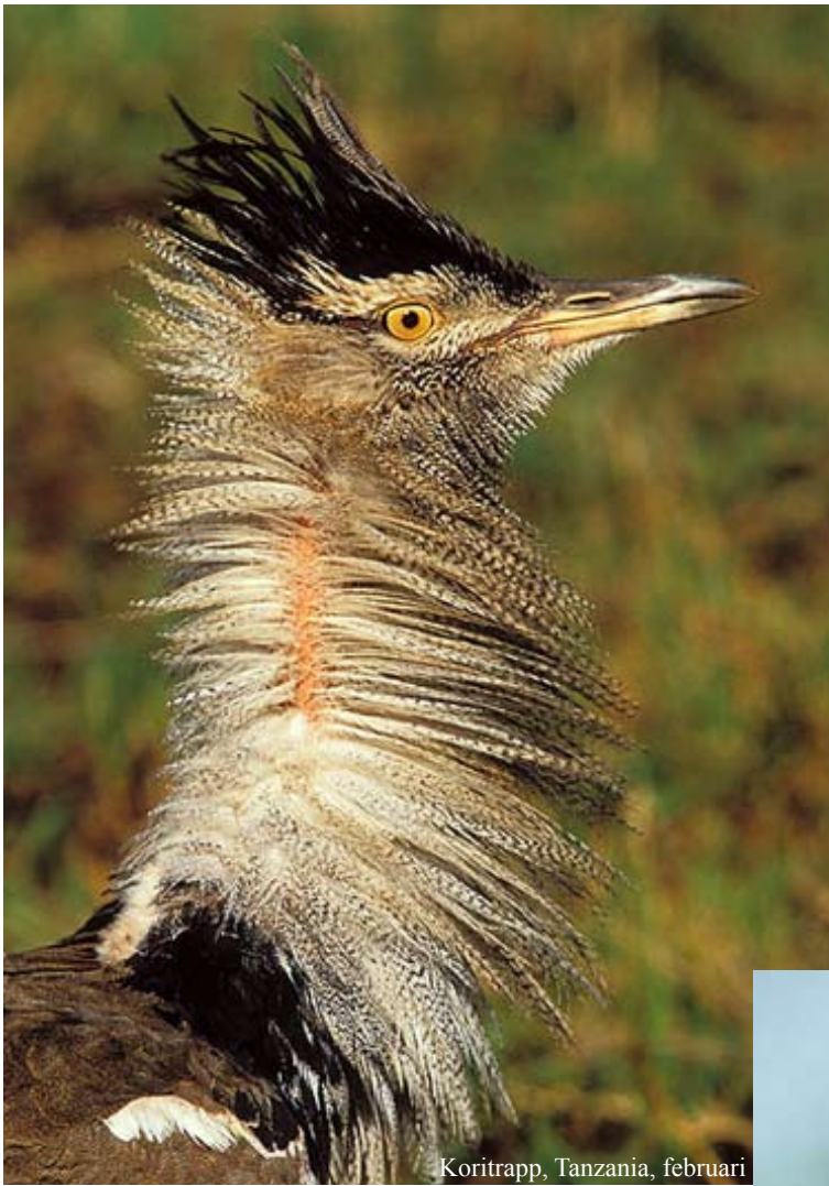
Koritrapp, Tanzania, februari